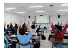
メンタルトレーニング講習会