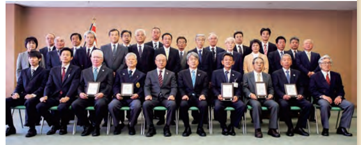
スポーツ少年団表彰日本本部・山口県本部授与式