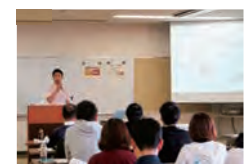
スポーツトレーナー研修会