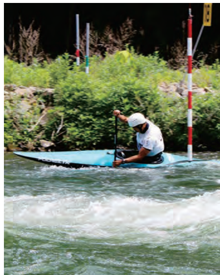
中国ブロック大会 カヌー競技