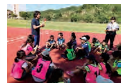
チャレンジキャンプ