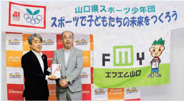
エフエム山口「スポーツ少年団応援」キャンペーン 寄付金贈呈式