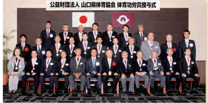
体育功労賞授与式