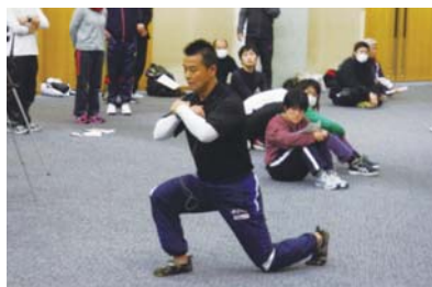
フィジカルトレーニング講習会