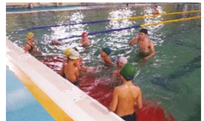
コーディネーターによる水泳教室指導