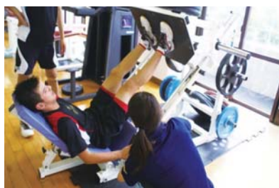
ジュニアアスリートサポート事業：体力測定