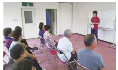
コーディネーターによるクラブ主催事業指導