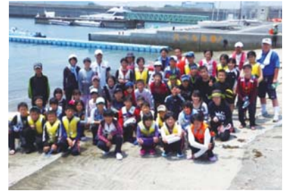
平成25年度ジュニアリーダースクール