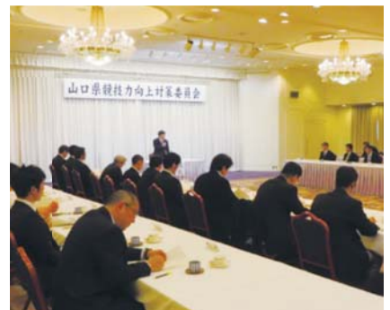
競技力向上対策委員会(第2回委員会)