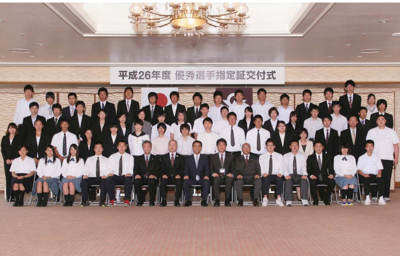
優秀選手指定証交付式