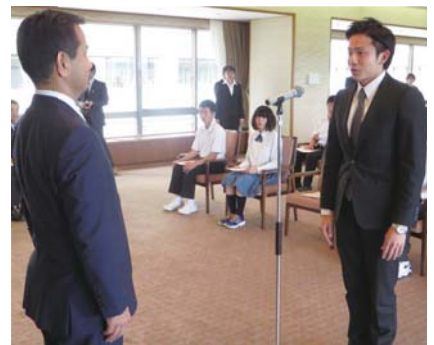
優秀選手指定証交付式