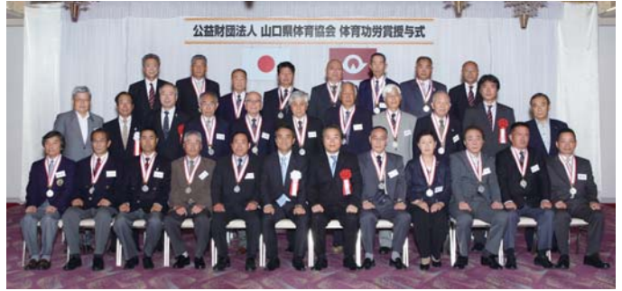
体育功労賞受賞者