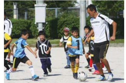
サッカー教室(活性化事業)