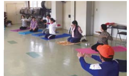
コーディネーターによるストレッチ指導

東部(徳山大学)、中部(県体育協会) 西部(東亜大学) 平成25年度巡回指導等実績:延べ466回