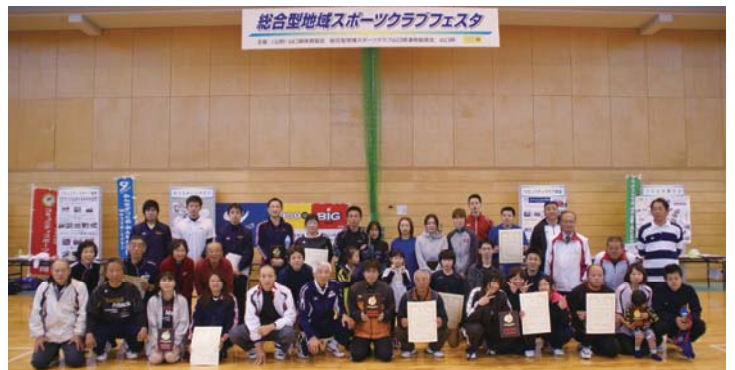
総合型地域スポーツクラブフェスタ

総合型地域スポーツクラブは、多世代、多志向、多種目により活動している特徴があり、身近な地域でスポーツを気軽に楽しむことができるスポーツクラブです。