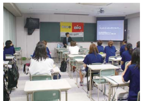
ドーピング講習会