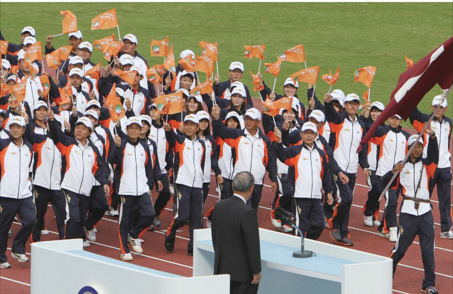
堂々と入場行進する山口県選手団