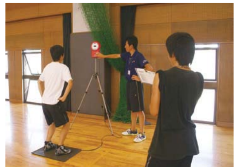
ジュニアアスリートサポート事業:体力測定